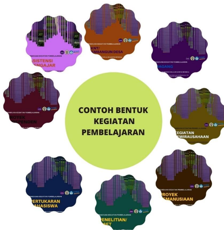
Gambar 1: Bentuk Kegiatan Pembelajaran MBKM

masyarakat di desa, mengajar di satuan pendidikan, mengikuti pertukaran mahasiswa, melakukan penelitian, melakukan kegiatan kewirausahaan, membuat studi/proyek independen, dan mengikuti program kemanusiaan.