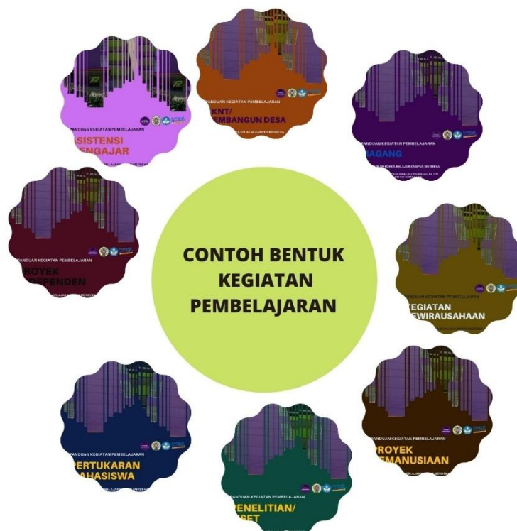
Gambar 1: Bentuk Kegiatan Pembelajaran MBKM

satuan pendidikan, mengikuti pertukaran mahasiswa, melakukan penelitian, melakukan kegiatan kewirausahaan, membuat studi/proyek independen, dan mengikuti program kemanusiaan.